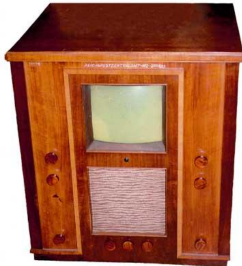
1934-35 Telefunken FE-III CRT 30cm (Germany)